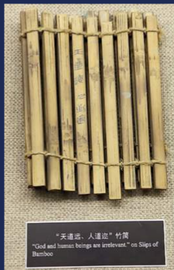
“天道远、人道近”竹简 "God and human beings are irrelevant." on Slips of Bamboo